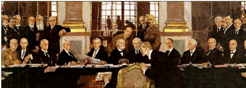
Йоханнес Белл від імені Німеччини підписує Версальський договір 28 червня 1919 р. Художник Вільям Орпен, 1920-ті рр.

Німеччина за договором визнавалася винною в розв'язуванні війни й разом зі своїми союзниками відповідальною за її результати. Вона повертала Франції Ельзас та Лотарингію, Бельгії — округи Ейлен, Мальме-ді та Морене (після проведення там плебісциту про згоду на це місцевого населення), Данії — Шлезвіг (також після плебісциту). Німеччина визнавала незалежність Польщі й Чехословаччини. До останньої відходила частина території Силезії. Польща отримувала окремі райони Померанії, Познані, більшість Західної і частину Східної Пруссії та частину Верхньої Силезії. Місто Данциг (Гданськ) із прилеглою до нього територією перетворювалося на «вільне місто» під керівництвом Ліги Націй. Однак воно включалося в митні кордони Польщі. Територія так званого «Данцизького коридору» відокремлювала Східну Пруссію від Німеччини. У свою чергу, Німеччина зобов'язувалася поважати нейтралітет Бельгії, повну незалежність Люксембургу й Австрії. Під управління Ліги Націй переходила Мемельська область, від прав на яку відмовлялася Німеччина. Її території на лівому й правому берегах Рейну вглиб на 50 км перетворювалися на демільтаризовану зону . Саарський вугільний басейн переходив у повну й необмежену власність Франції, а сама область на 15 років залишалася під управлінням Ліги Націй із подальшим проведенням плебісциту про її державну належність. Загалом Німеччина втрачала 1/4 своєї території та 1/12 населення.