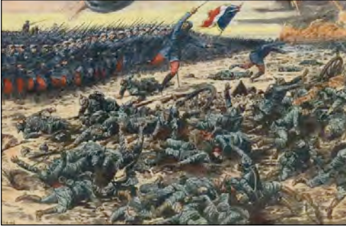
«Диво на Марні»: французькі війська атакують німців. Листівка 1914 р.

військово-тактичні особливості Першої світової війни — переважання фронтальних бойових дій, що супроводжувалися величезними втратами обох сторін.