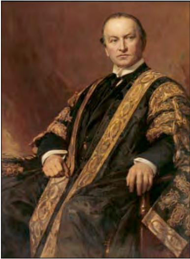
Лорд Джордж Натаніел Керзон, міністр закордонних справ англійського уряду (1919—1924 рр.), у минулому — віцекороль Індії. Художник Саймон Маккормак, 1907 р.

Тимчасового уряду Росії. Вони зображували делегатів України як колишніх німецько-австрійських союзників або пробільшовицьки налаштованих політиків. Американська делегація виступала за надання українцям лише автономії у складі новоутворених держав. Серед учасників американської делегації були громадяни США, що походили з України, тому вони розуміли суть «українського питання».