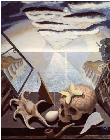
Віконні ступки у нескінченність. Художник Леон Андервуд, 1930 р.

У соціальній структурі суспільства місце еліти посіли великі промисловці та фінансисти й представники колишньої аристократії. Новим явищем стало формування середнього класу. Завдяки стабільному становищу він був зацікавлений у проведенні такої внутрішньої політики, яка унеможливила б соціальні потрясіння. У середовищі робітників вагоме місце посіла робітничка аристократія — робітники з високою професійною