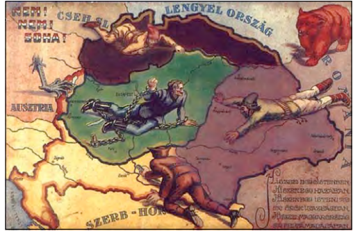
Результати Тріанонського договору для Угорщини. Карикатура 1920 р.

Для врегулювання відносин із Туреччиною на більш компромісній основі у швейцарському місті Лозанна 20 листопада 1922 р. відкрилася мирна конференція, що тривала з перервами до 23 липня 1923 р. У переговорах із Туреччиною брали участь делегації Великої Британії, Франції, Італії, Японії, Греції, Румунії, Королівства сербів, хорватів і словенців, Болгарії та радянських республік (Росії, України, Грузії).