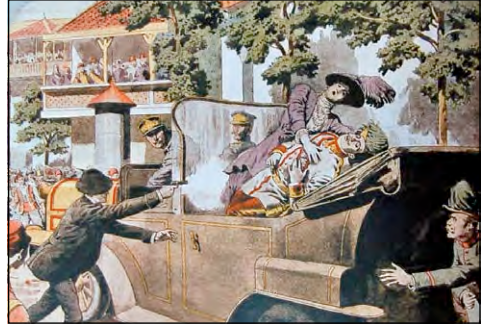
Убивство ерцгерцога Франца Фердинанда та його дружини 28 червня 1914 р. в Сараєві

національного трауру — вшанування сербів, що загинули в битві з турками на Косовому полі в 1389 р. Сербські націоналістичні кола сприйняли візит ерцгерцога як образ. У Відні результатів розслідування очікувати не стали. Німецький імператор Вільгельм II запропонував австро-угорському імператору Францу Йосифу використати вбивство в Сараєві як привід для оголошення війни Сербії. 23 липня австро-угорський уряд висунув Сербії вимоги, заздальгідь розуміючи, що вона їх відхилить.