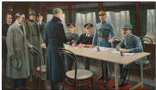
Підписання мирного договору, що поклав край бойовим діям у Першій світовій війні. Це відбулося в залізничному вагоні маршала Ф. Фоша в Комп'єнському лісі 11 листопада 1918 р.