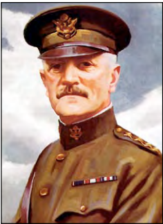
Джон Першинг, генерал армії США

Вступ у війну США. Тривалий час США утримувалися від прямої участі у війні, постачаючи зброю, боєприпаси і продовольство країнам Антанти й одночасно здійснюючи торгівлю через нейтральні країни з їхніми противниками. Однак інтересам США відповідала перемога Антанти. У роки війни вони надали державам Антанти та її союзникам кредитів на суму понад 10 млрд доларів і турбувалися про повернення цих коштів. Також правлячі кола США, прагнучи відігравати вагомий роль у світі, усвідомлювали, що без участі у війні не зможуть претендувати на частку в розподілі «післявоєнного пирога».