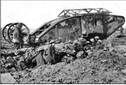
Британський танк «Марк I», що брав участь у першому у світі танковому бою під час битви на Соммі 15 вересня 1916 р.

зростання незадоволення населення. Генерал Е. Людендорф характеризував становище Німеччини як «надзвичайно важке й майже безвихідне». Президент Франції Р. Пуанкаре заявляв: «Повсюдно серед населення Парижа помітний тривожний настрій, кількість тих, хто не вірить у перемогу, зростає. Починаються страйки». Солдати на фронтах втомилися від тривалої війни й окопного життя. Поширювалися відмови йти в атаку, солдатські бунти, убивства офіцерів, випадки дезертирств і братання із солдатами противника.