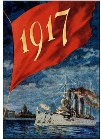
Залп крейсера «Аврора». Художник Анатолій Семенцов-Огієвський, 1955 р.

Плани держав Антанти стосовно військової кампанії на 1917 р. передбачали одночасний наступ на всіх європейських фронтах. Початок Російської революції зробив неможливим наступ російських військ. Під впливом революційних подій у Росії хвиля страйків під антивоєнними гаслами