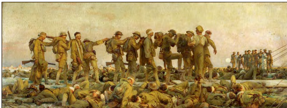
Отруєні газом. Художник Джон Сінгер Сарджент, 1918 р.

12 липня 1917 р. німці, намагаючись зупинити наступ противника, уперше застосували під Іпром ще одну нову хімічну зброю — гірчичний газ, який за місцем боїв назвали іпритом. У листопаді-грудні війська Антанти здійснили вдалу наступальну операцію в районі міста Камбре («тріумф танків»). У ході операції 378 британських танків у взаємодії з піхотою та авіацією завдали удару по добре укріпленій обороні противника й прорвали її. Розвинути успіх британці не змогли, але наочно продемонстрували переваги використання танків під час наступу.