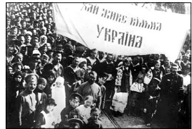
Демонстрація в Києві під гаслом «Хай живе вільна Україна» в березні 1919 р.

У ставленні до «українського питання» позиції делегацій держав-переможниць суттєво відрізнялися. При цьому на них значно впливала антиукраїнська кампанія польської делегації й міністрів колишнього