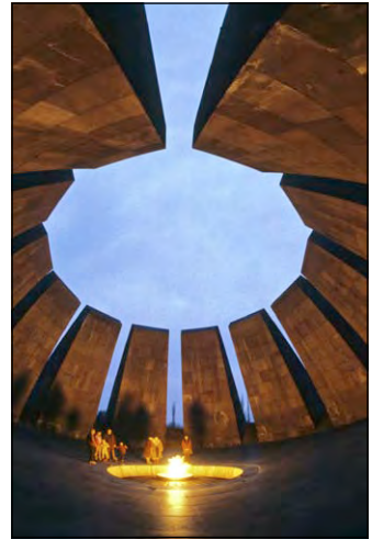
Меморіальний комплекс у Єревані (Вірменія), присвячений пам'яті жертв геноциду 1915 р.

У Палестині та Іраку виникли Палестинський і Месопотамський фронти, де турецька армія воювала з військами Великої Британії.