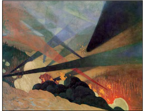
Вердени. Художник Фелікс Валлоттон, 1917 р.

21 лютого 1916 р., випустивши з важких гармат понад 2 млн снарядів по Вердену та його околицях, 12 німецьких дивізій на ділянці фронту в 10 км перейшли в атаку. Німецькі солдати під Верденом уперше використали нову зброю — вогнемети. 25 лютого німці захопили форт Дуомон, що панував над фортецею й усією місцевістю. Французьке командування для уникнення катастрофи перекинуло під Верден військові частини з інших ділянок фронту. У результаті цього на початок березня кількість французьких військ зросла вдвічі. Стало зрозуміло, що німецький план операції провалився. За наступні кілька місяців німці заглибилися у французьку оборону лише на 7 км, але захопити Верден не змогли. Верденська «м'ясорубка», або «млин» Мааського району, як його називали німці, завершилася в грудні 1916 р.