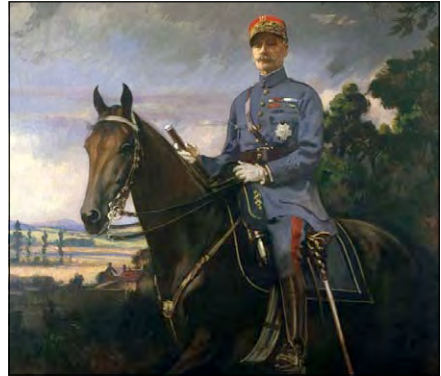
Французький маршал Фердинанд Фош. Художник Едмунд Тарбелл, 1920 р.

3 листопада командування австро-угорської армії капітулювало й підписало перемир'я з Антантою. Того самого дня в Німеччині спалахнула революція. Країну проголосили республікою. Позбавлений престолу імператор Вільгельм II втік до Нідерландів. Уряд Німецької республіки сформував делегацію, яка 7 листопада 1918 р. прибула на залізничну станцію Ротонд у Комп'єнському лісі для переговорів про перемир'я. Союзники в ультимативній формі оголосили умови перемир'я, заснованого на «14 пунктах» В. Вільсона. Відповідно до нього німці негайно залишали всі окуповані території на Заході, а на території колишньої Російської імперії (Україна та Прибалтика) тимчасово залишалися, щоб запобігти встановленню над ними контролю більшовиків. Термін перемир'я становив 36 діб.