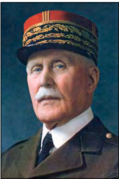
Анрі Філіпп Петен, французький генерал, герой оборони Вердена

3 Воєнні дії в 1917 р. Наприкінці 1916 р. генеральні штаби держав Антанти домовилися навесні 1917 р. здійснити одночасний наступ на всіх європейських фронтах із метою звільнення територій своїх і союзних країн від німецьких військ. Командування Четверного союзу в планах на 1917 р. вирішило дотримуватися оборони. Німеччина великі надії покладала на підводну війну. До літа 1917 р. кількість суден, переважно британських, що гинули від атак німецьких підводних човнів, постійно зростала. Однак Антанті вдалося знайти ефективний засіб захисту від них — «систему конвоїв».