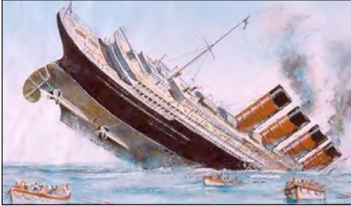
Загибель пасажирського пароплава «Лузитанія» біля берегів Ірландії після торпедної атаки німецького підводного човна «U-20»