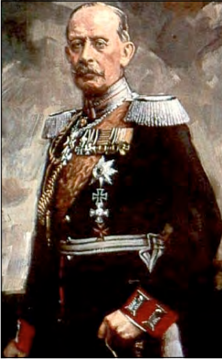
Генерал Альфред фон Шліффен

Бліцкриг (у перекладі — «блискавична війна») — теорія ведення агресивної війни, розрахована на капітуляцію противника в найкоротші строки внаслідок раптового нападу на нього й швидкого просування в глиб країни.