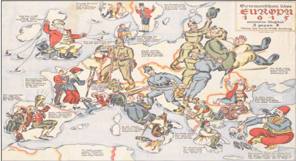
Перша глобальна війна у світі. Карикатура 1915 р.

людством. Вона постійно нагадувала народам про себе втратами й каліцтвами близьких і рідних, але не стала останньою пересторогою.