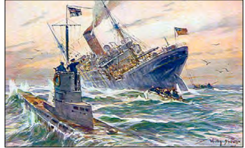
Потоплення британського пароплава німецьким підводним човном. Художник Віллі Стовер, 1915 р.

зброї — підводних човнів, розгорнувши підводну війну. У перші дні війни підводні човни показали свою ефективність. Так, 22 вересня 1914 р. німецький підводний човен «U-9» поблизу узбережжя Нідерландів за одну атаку потопив три британські крейсери, залишившись неушкодженим.