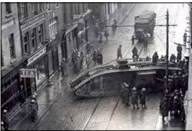
Британська артилерія й танки на вулицях Дубліна під час повстання у квітні 1916 р. в Ірландії

1. Яким було ставлення А. Барбюса до побаченого під Верденом? 2. Як, на вашу думку, розповідь про реальну картину війни вплинула на антивоєнний рух у Франції?